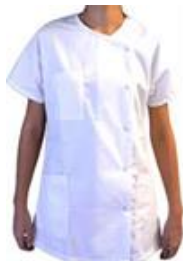
A LA PRISE DE POSTE